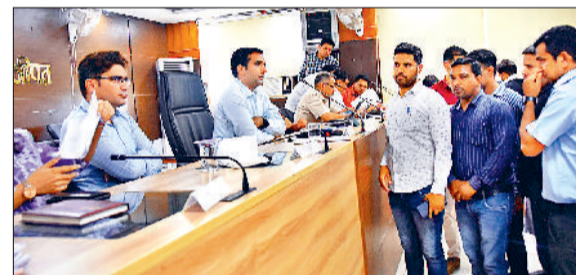
सोनीपत। उपायुक्त को ज्ञापन देने पहुंचे एसोसिएशन के सदस्यगण।