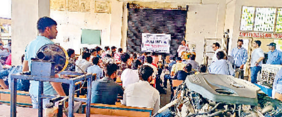
खरखौदा। रोजगार मेले में बच्चों को संबोधित करते अधिकारी।

युवाओं को रोजगार प्रदान करने के लिए औद्योगिक प्रशिक्षण संस्थान और जिला रोजगार कार्यालय के संयुक्त तत्वाधान में आईटीआई खरखौदा परिसर में रोजगार मेले का आयोजन किया गया। बतौर मुख्यातिथि मेले का शुभारंभ करते हुए दिल्ली इलेक्ट्रिक ऑटो प्राइवेट लिमिटेड कंपनी के निदेशक वीरेन