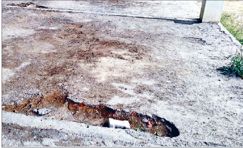
गन्नौर। उदेशीपुर गांव की चौपाल में टूटा हुआ फर्श व शौचालयों में पड़ी गंदगी व अन्य कूड़ा।

सूबे के मुख्यमंत्री ने प्रदेश में 100 और व्यायामशालाएं खोलने की तैयारी शुरू कर दी है। जरूरी है आज के समय में लोगों को स्वास्थ्य के प्रति सजग करना और खिलाड़ियों की नई पौध लगाना। लेकिन सिर्फ कागजी व्यायामशालाओं के सहारे आम जनता कैसे सजग हो पाएगी। जिले में अभी मौजूदा समय में भी कुल 84 जगहों पर व्यायामशालाएं चल रही हैं। जिसमें से अधिकतर केवल योग शिक्षकों के सहारे ही गुजारा कर रही है। अधिकतर व्यायामशालाओं में सुविधाओं का टोटा है। सिर्फ नाम की व्यायामशालाएं बना दी गई हैं। जिनमें से कई जगहों पर तो जुआरी और नशेदियों का कब्जा रहता है। कुछेक चुनिंदा ऐसी व्यायामशालाएं हैं, जहां पर अकेला योग शिक्षक ही लोगों को स्वस्थ रखने की पहल छेड़े हुए हैं। लेकिन ये संख्या ना के बराबर ही है। जिला आयुर्वेद