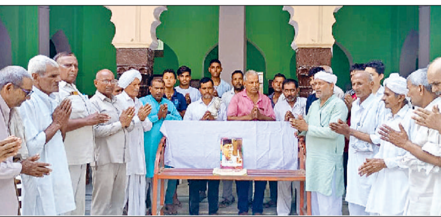
गोहाना। वीपी सिंह के चित्र पर पुष्प अर्पित करके नमन करते हुए नागरिक।