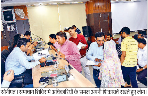
सोनीपत। समाधान शिविर में अधिकारियों के समक्ष अपनी शिकायतें रखते हुए लोग।

जिले में आयोजित किए जा रहे समाधान शिविर की कड़ी में मंगलवार को भी शिविर का आयोजन किया गया। मंगलवार को जिले में कुल 115 शिकायतें दर्ज की गईं। जिसमें से केवल 29 शिकायतों का ही मौके पर समाधान हो पाया। वहीं 86 शिकायतें ऐसी रही, जिनका कोई समाधान नहीं हो पाया। वहीं अब तक के लेखा-जोखा की बात करें तो जिले में 10 जून से जारी समाधान शिविर में अब तक कुल 1026 शिकायतें आई हैं। इनमें से 300 शिकायतों का मौके पर ही