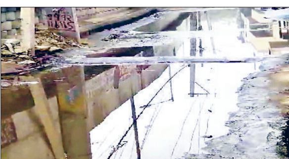
गन्नौर। बीएसटी आरओबी के पास सड़क पर भरा दूषित पानी।

बीएसटी रेलवे ओवरब्रिज के पास दूषित पानी की निकासी के लिए बना नाला स्थानीय लोगों की परेशानी को बढ़ा रहा है। नाला ओवरफ्लो होने के चलते दूषित पानी सड़क पर बह रहा है। स्थानीय लोगों ने नगरपालिका द्वारा नालों की सफाई न करवाने के विरोध में रोष व्यक्त किया। स्थानीय लोगों ने बताया कि गंदे पानी की निकासी के