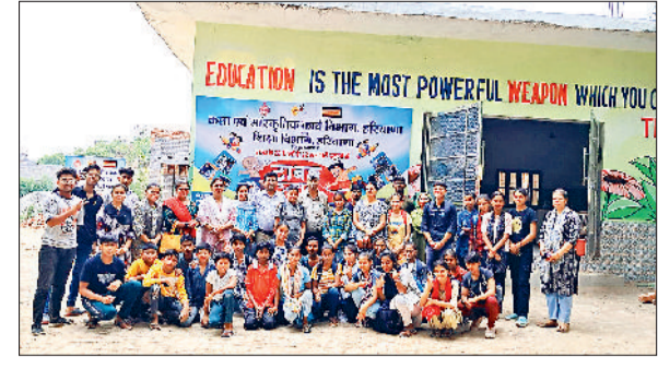
सोनीपत। विद्यालय में निरीक्षण के लिये पहुंचे अधिकारी एवं अन्य।